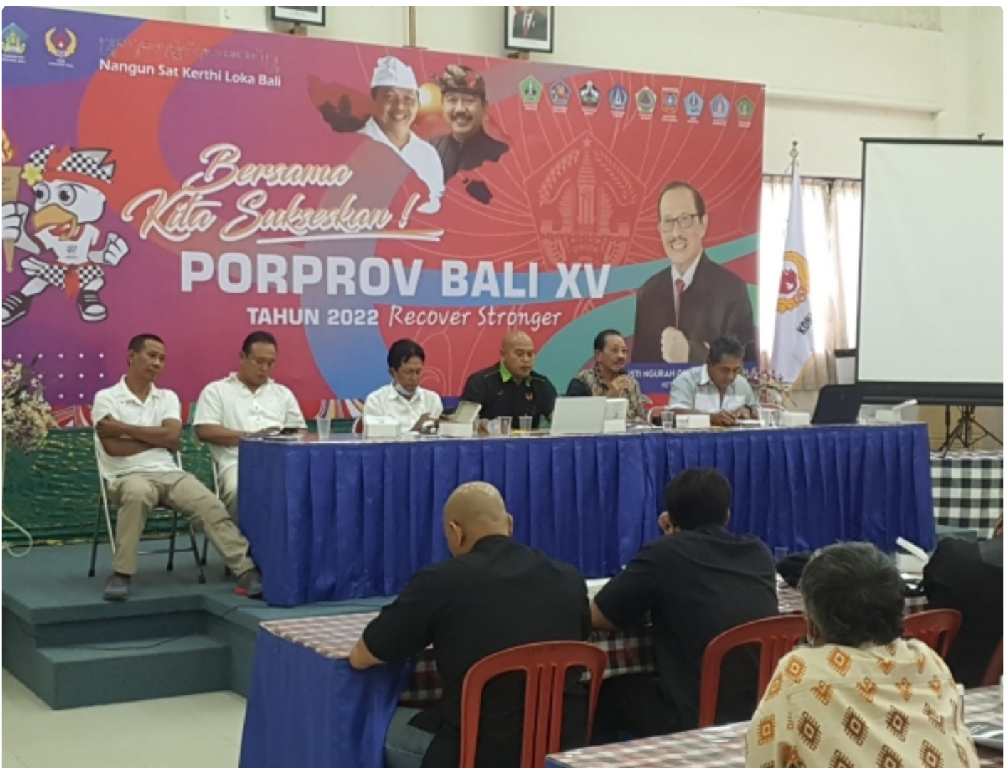
Jelang Porprov Bali/XV 2022, bahas persiapan legiatan Porprov

DENPASAR - Menapaki perhelatan Porprov Bali/XV tahun 2022, KONI Provinsi Bali gelar rapat tahapan menjelang kegiatan akbar ini. Rapat Technical Delegate (TD) Cabang Olahraga (Cabor) dan Koordinator Wilayah dalam rangka