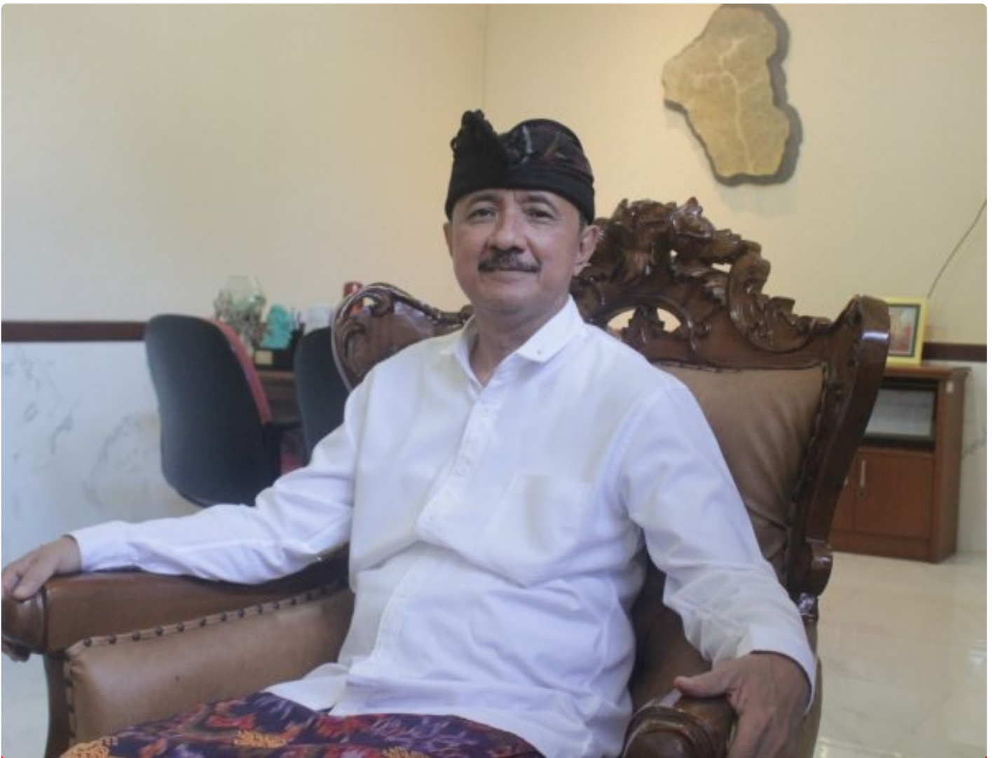
Tjok Bagus Pemayun, Kepala Dinas Pariwisata Provinsi Bali.

Oleh; Tjok Bagus Pemayun, Kepala Dinas Pariwisata Provinsi Bali